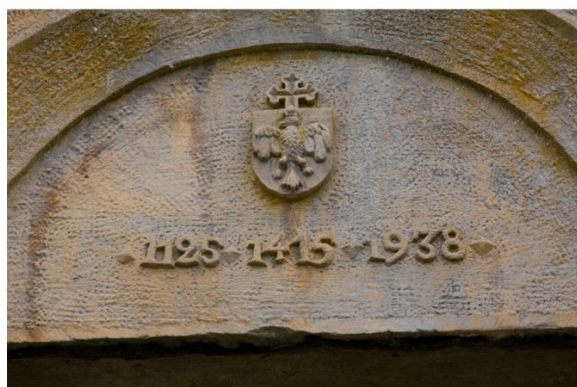
Tympan de la porte d'entrée