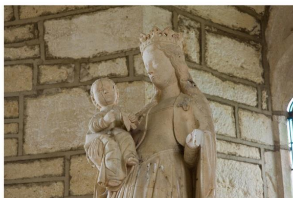
Vierge à l'Enfant et l'oiseau