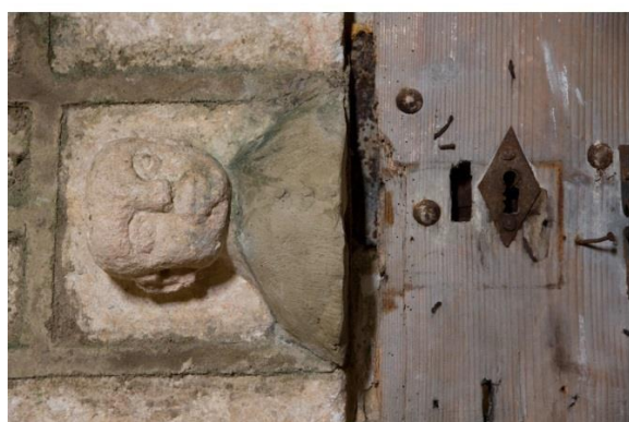
Oratoire primitif (détail)