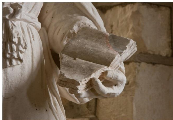
St Jacques le Majeur (détails)