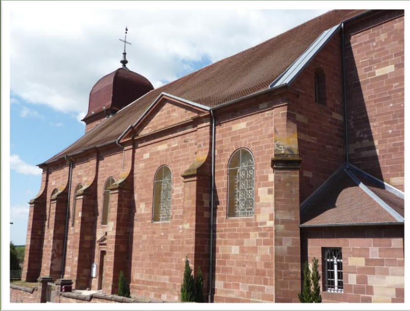
Eglise de Villers-sur-Saulnot (Haute-Saône)