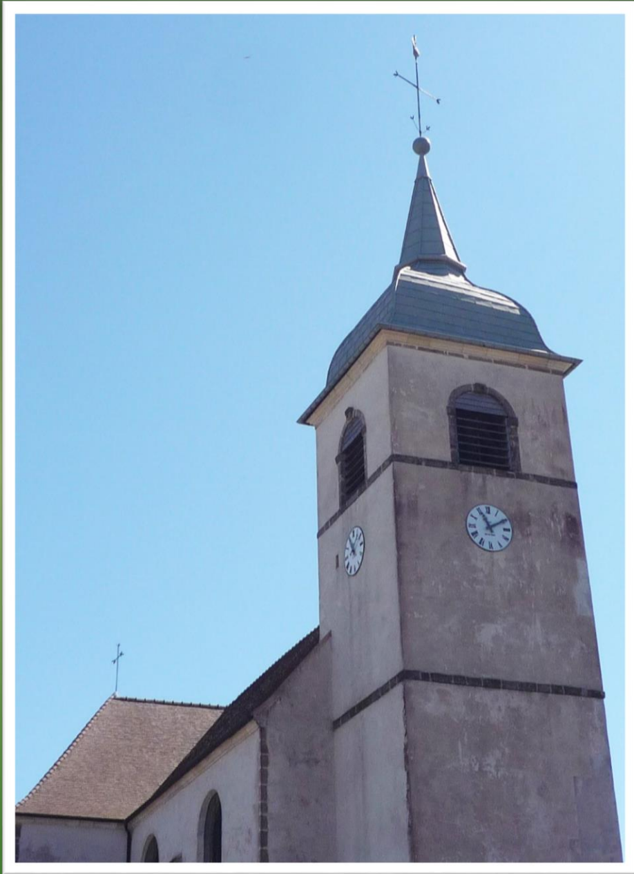
Eglise d'Offlanges (Jura)