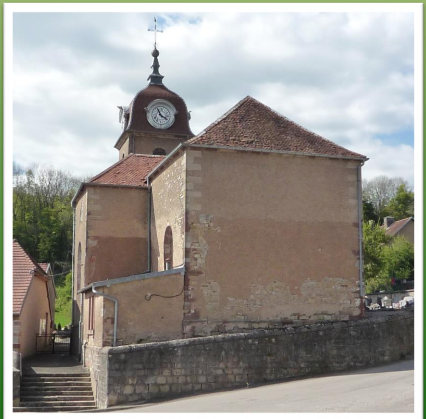
Eglise de Vellechevreux (Haute-Saône)