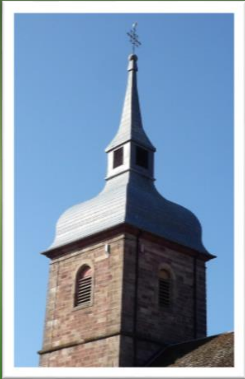
Eglise de Buc (Territoire de Belfort)