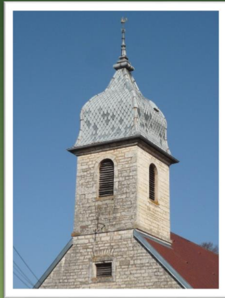
Eglise de Brevilliers (Haute-Saône)