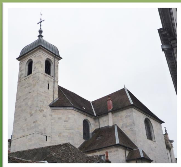
Eglise Saint-Maurice - Besançon (Doubs)