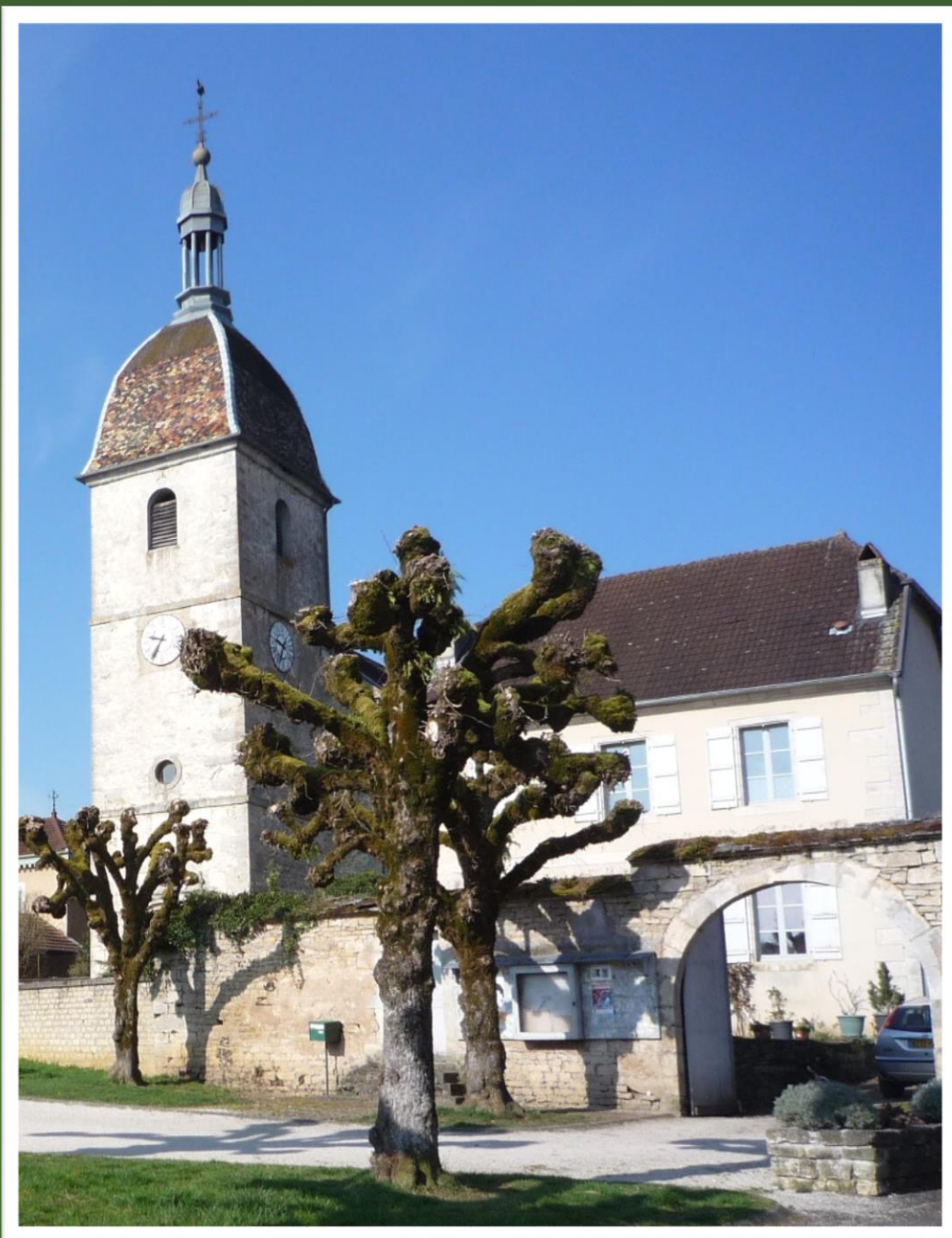
Eglise d'Authoison (Haute-Saône)