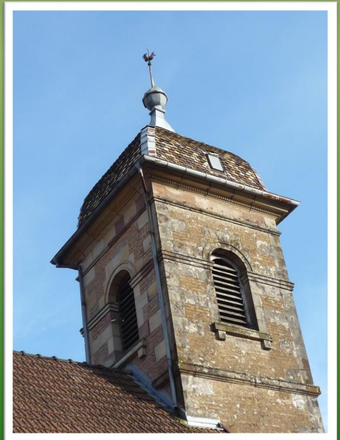
Temple de Couthenans (Haute-Saône)