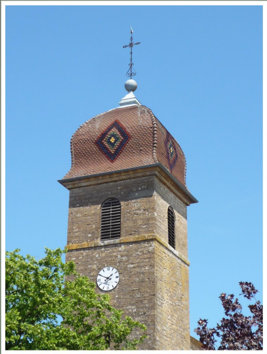
Eglise d'Audeux (Doubs)